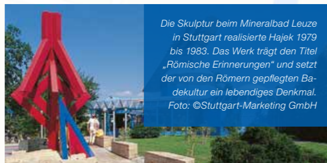
Die Skulptur beim Mineralbad Leuze in Stuttgart realisierte Hajek 1979 bis 1983. Das Werk trägt den Titel „Römische Erinnerungen“ und setzt der von den Römern gepflegten Badekultur ein lebendiges Denkmal.

Für die Fahrradtour, den Kinderworkshop und die Führung durch den Hajek-Hain gilt eine begrenzte Teilnehmerzahl.