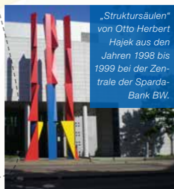
„Struktursäulen“ von Otto Herbert Hajek aus den Jahren 1998 bis 1999 bei der Zentrale der Sparda-Bank BW.

8. Juni | 20. Juli 2024, Beginn jeweils 14 Uhr. Dauer: 1,5 Std. Treffpunkt jeweils um 14 Uhr, Hasenbergsteige 65, 70197 Stuttgart