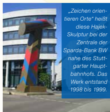
„Zeichen orientieren Orte“ heißt diese Hajek-Skulptur bei der Zentrale der Sparda-Bank BW nahe des Stuttgarter Hauptbahnhofs. Das Werk entstand 1998 bis 1999.